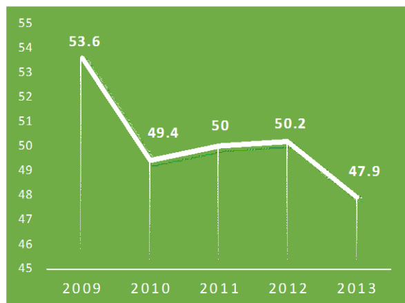
Gráfico N°3: Evolución del ILE Bolivia

El año 2012 Bolivia tuvo un puntaje de 50.2 sobre 100 en el puntaje del ILE. Esto significaba que Bolivia aún permanecía en el grupo de países con una economía "Mayormente Controlada". Pero el 2013 la circunstancia cambió: Bolivia descendió a 47.9 puntos del ILE, esto significa entrar al grupo de países con economías "Reprimidas".